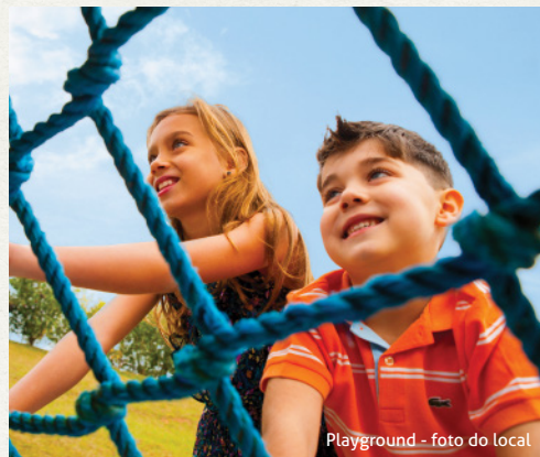
Playground - foto do local