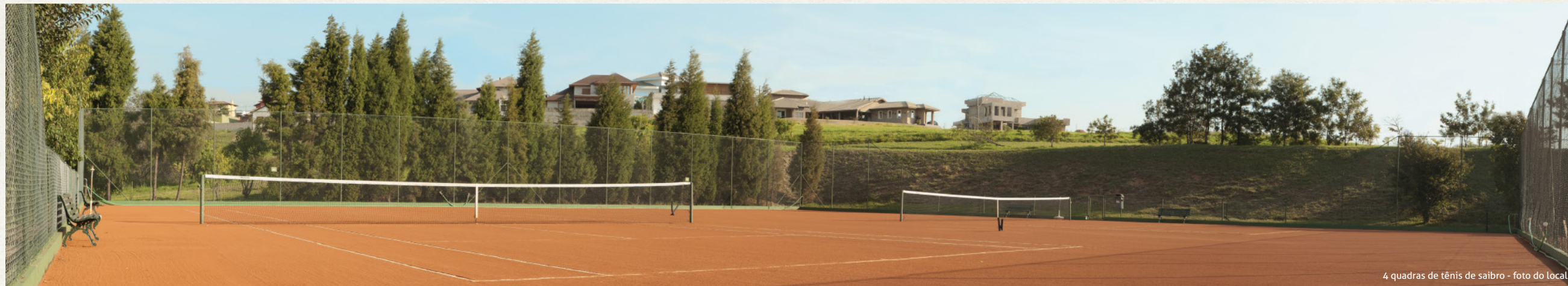
4 quadras de tênis de saibro - foto do local