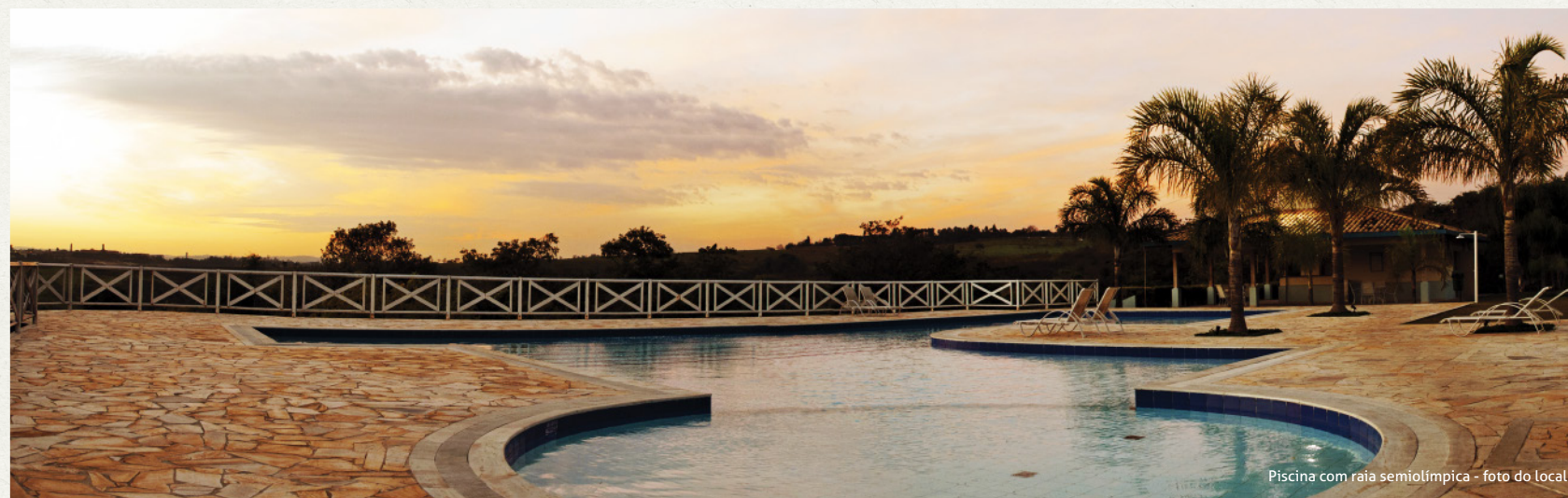
Piscina com raia semiolímpica - foto do local

Infraestrutura completa e inúmeras opções de lazer.