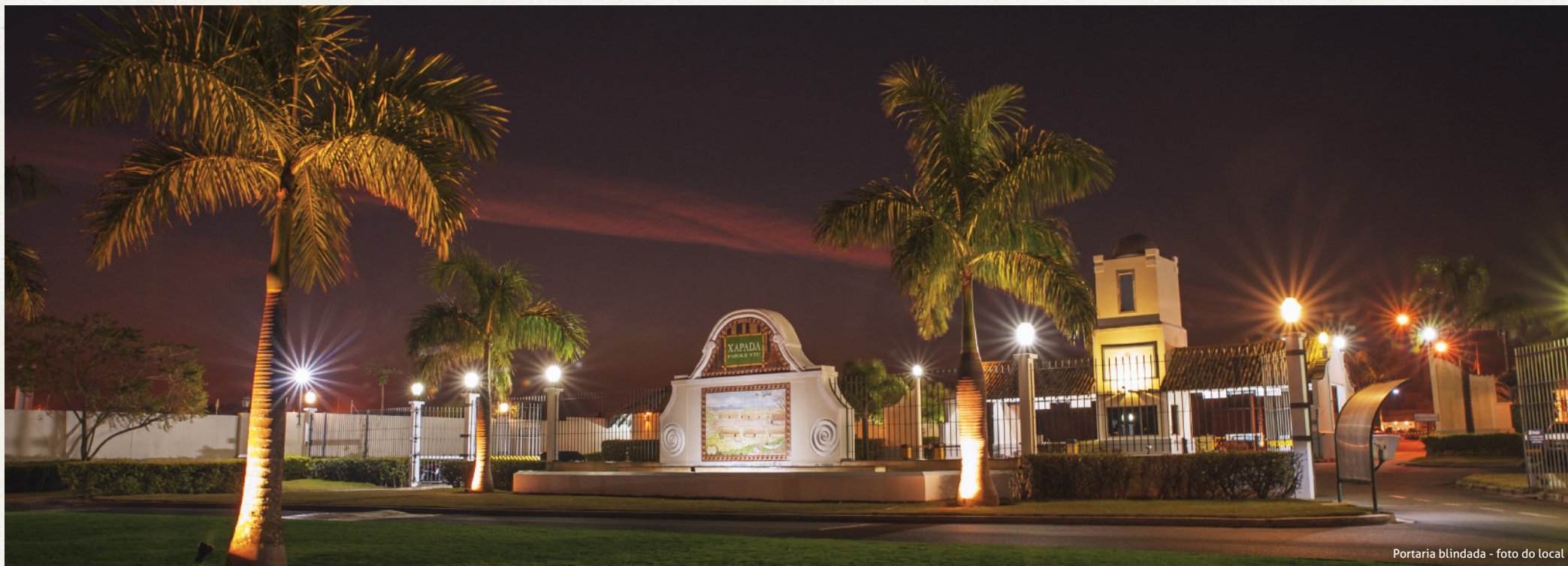
Portaria blindada - foto do local

O Parque Ytu Xapada fica a apenas 10 minutos do centro de Itu, perto de escolas, mercados, centros comerciais e dos tradicionais restaurantes da cidade.