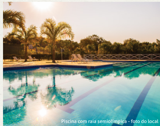
Piscina com raia semiolímpica - foto do local