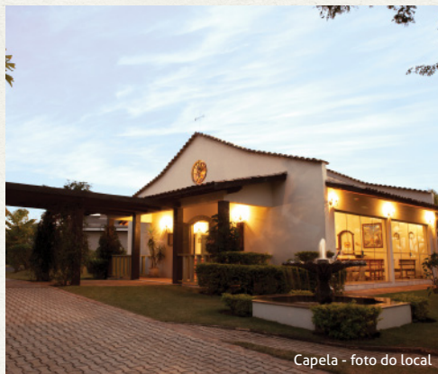
Capela - foto do local