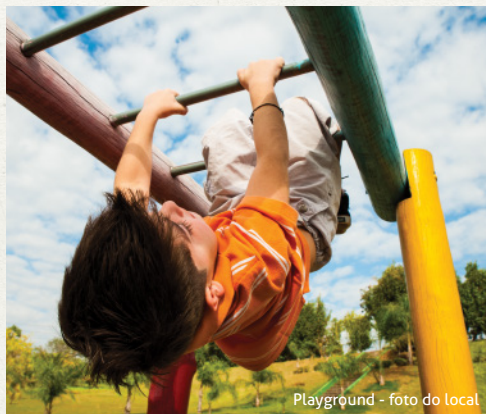
Playground - foto do local