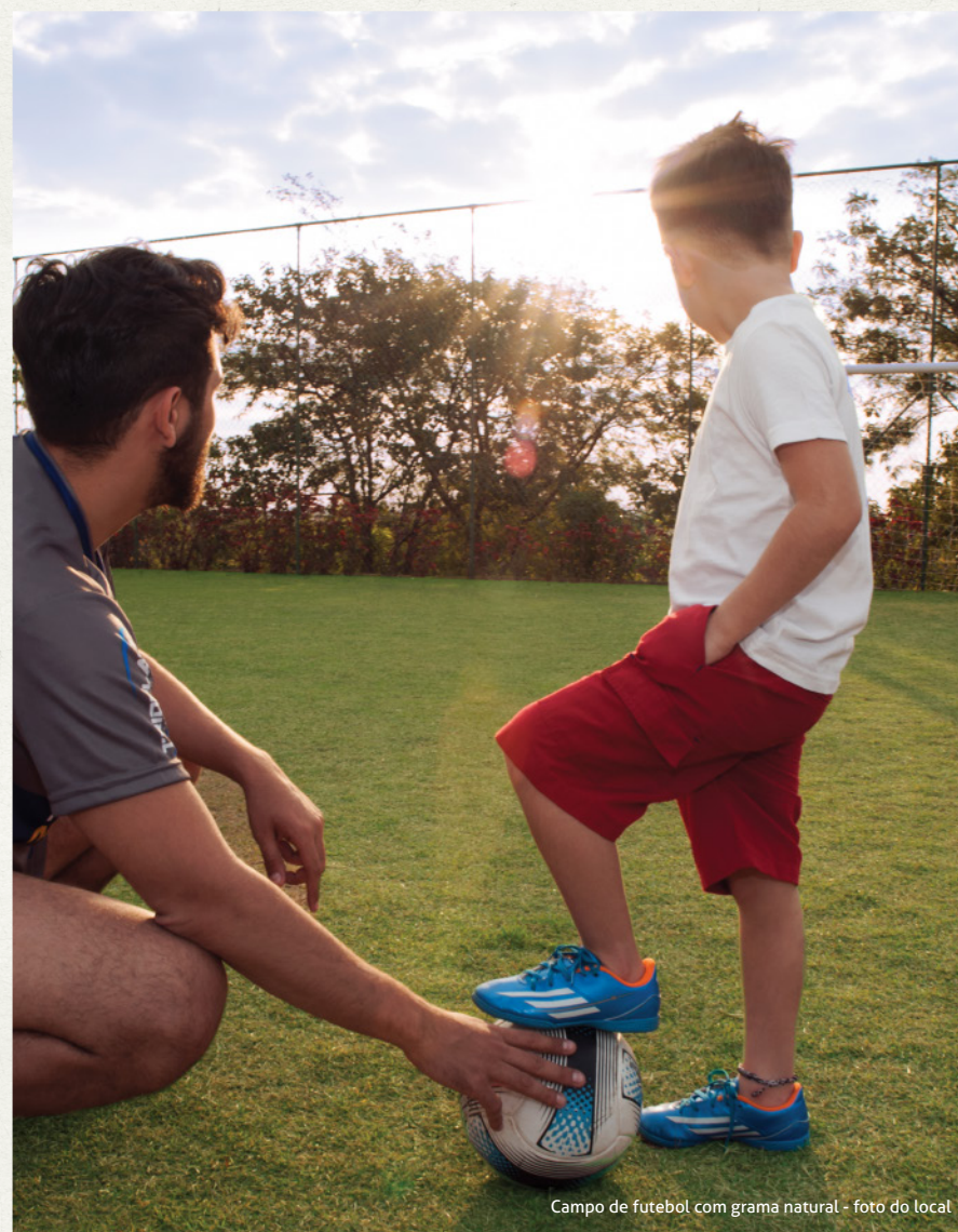
Campo de futebol com grama natural - foto do local