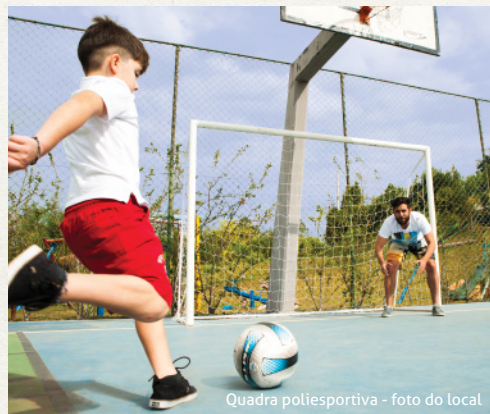
Quadra poliesportiva - foto do local