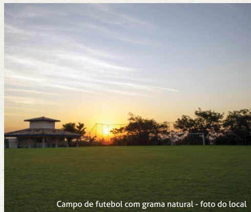
Campo de futebol com grama natural - foto do local